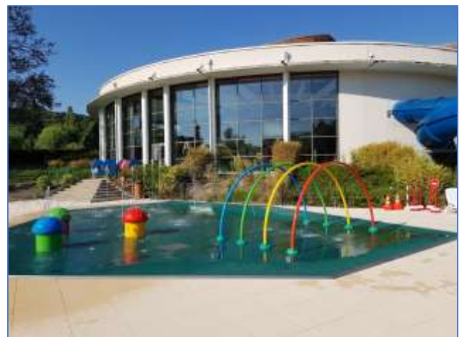
Jeux aquatiques solarium piscine