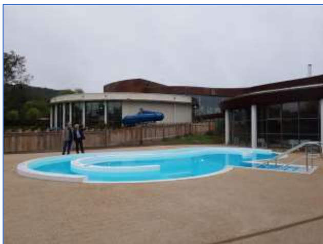
Aménagement bassin Espace Forme